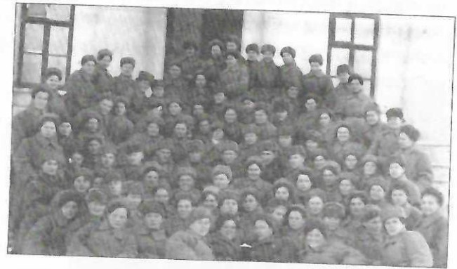
На этой она этой она после сдачи крови там же в Чебоксарах.

На этой фотографии она изображена после получения в Чебоксарах обмундирования.