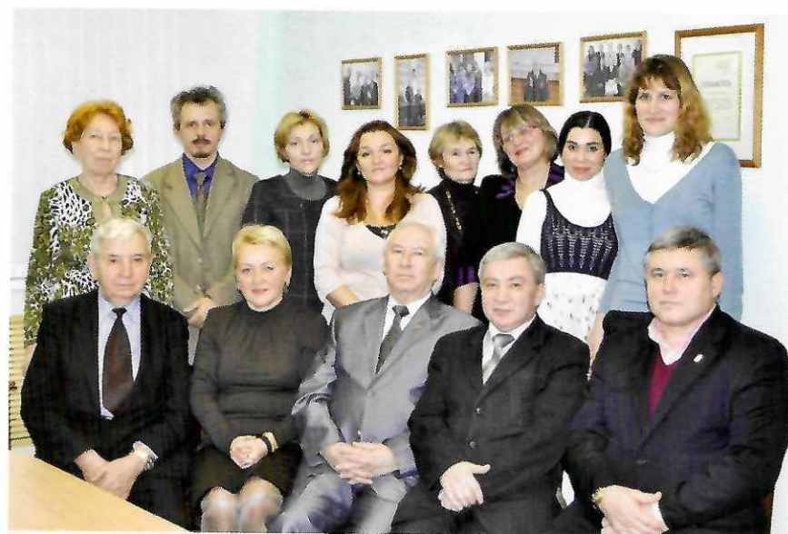
Преподаватели кафедры истории и культурологии Казанского государственного архитектурно-строительного университета.