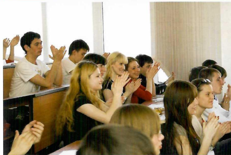
Герой Советского Союза С.А.Ахтямов на встрече со студентами КГАСУ. 28 апреля 2009 г.