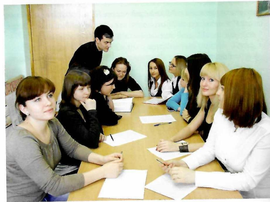
Заседания актива поискового проекта «Факел».