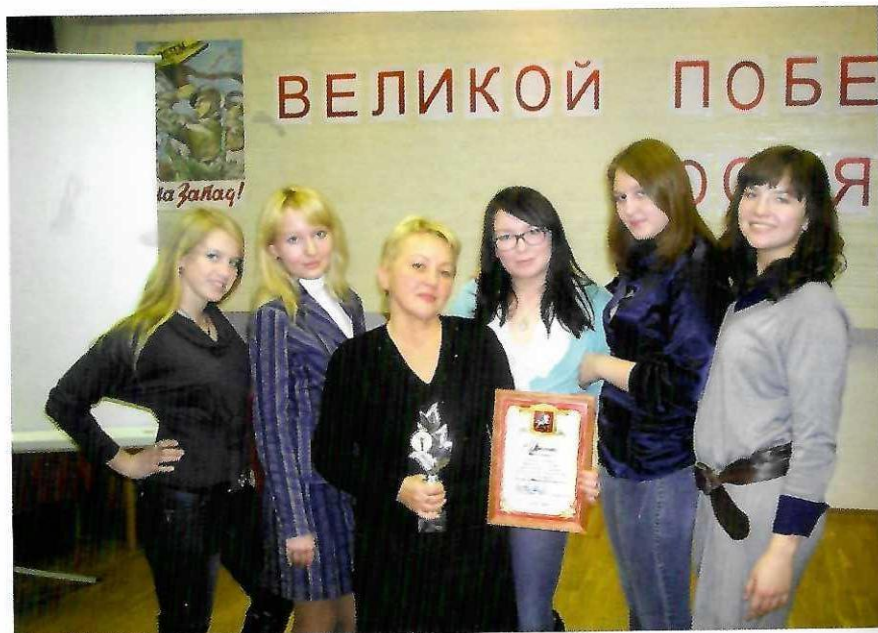
Активисты проекта «Факел» - победители городского (г.Казань) тура интеллектуальной игры «65 лет Великой Победы».