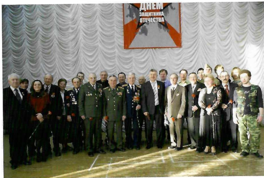
Ветераны войны – почетные гости Университета.