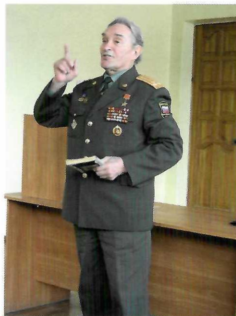
Герой Советского Союза Б.К.Кузнецов на встрече со студентами КГАСУ. 12 декабря 2009 г.