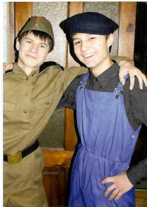
Такими же молодыми уходили бойцы на войну в далеком 1941...