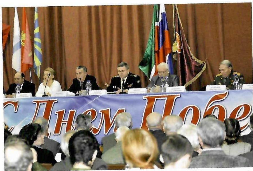
Республиканская конференция «Народ и армия в Великой Отечественной войне 1941-1945 гг.», посвященная 65-й годовщине Великой Победы. Президиум.