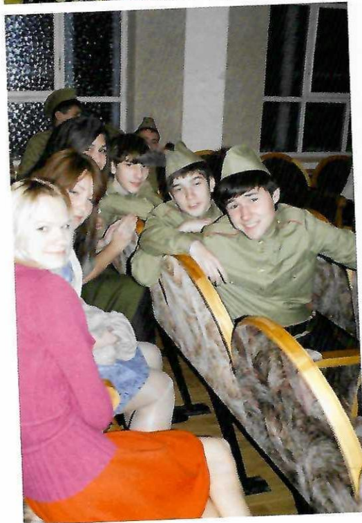
Студенты КГАСУ – участники интеллектуальной игры «65 лет Великой Победы».