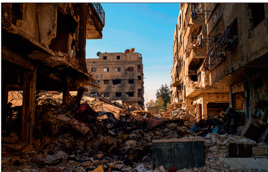
Разрушенный боевиками ИГИЛ Дамаск.

Террористы поставили на поток производство видеороликов с жестокими сценами казней пленников, заложников и «вероотступников». Эти материалы потом широко распространяются в социальных сетях и